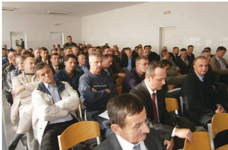
Prolongiran rok za polaganje periodičnih ispita

Privodi se kraju i remont „južne pruge“, zahvaljujući tome biće moguće ostvariti veće brzine. Uz remont ide i remont signalno-sigurnosnih, telekomunikacionih i ostalih uređaja. Sve