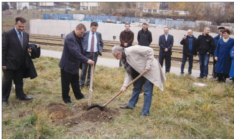
Simbolični čin sadnje jabuke u voćnjaku JR TPK „Sušica“

–Kad sam prvi put vidio Tehničku stanicu „Sušica“, odnosno, stanje u kojem se nalazila, mislio sam da ću doživjeti infarkt. Sve je bilo tako zapušteno i prljavo, da nisam mogao vjerovati da je tako nešto moguće. Međutim, naši vrijedni željezničari uspjeli su uraditi