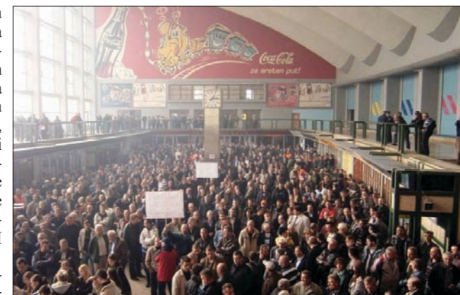
Željezničari traže ravnopravan tretman cesta i željeznica

Ministar Bijičić se obratio skupu sa konstataci-