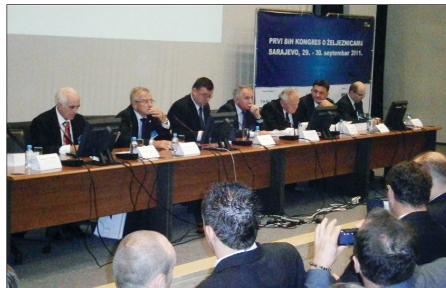
Kongres je okupio veliki broj eminentnih stručnjaka

-Percepcija o željeznicama, ne samo u javnosti, nego i među kreatorima transportne politike u BiH, ne odgovara stvarnoj slici. Treba znati i istaći, da je poslovni rezultat, u dijelu poslovanja na koji menadžment željeznice može bez ograničenja utjecati (željeznički operator), pozitivan, a da poslovni rezultat dijela poslovnog